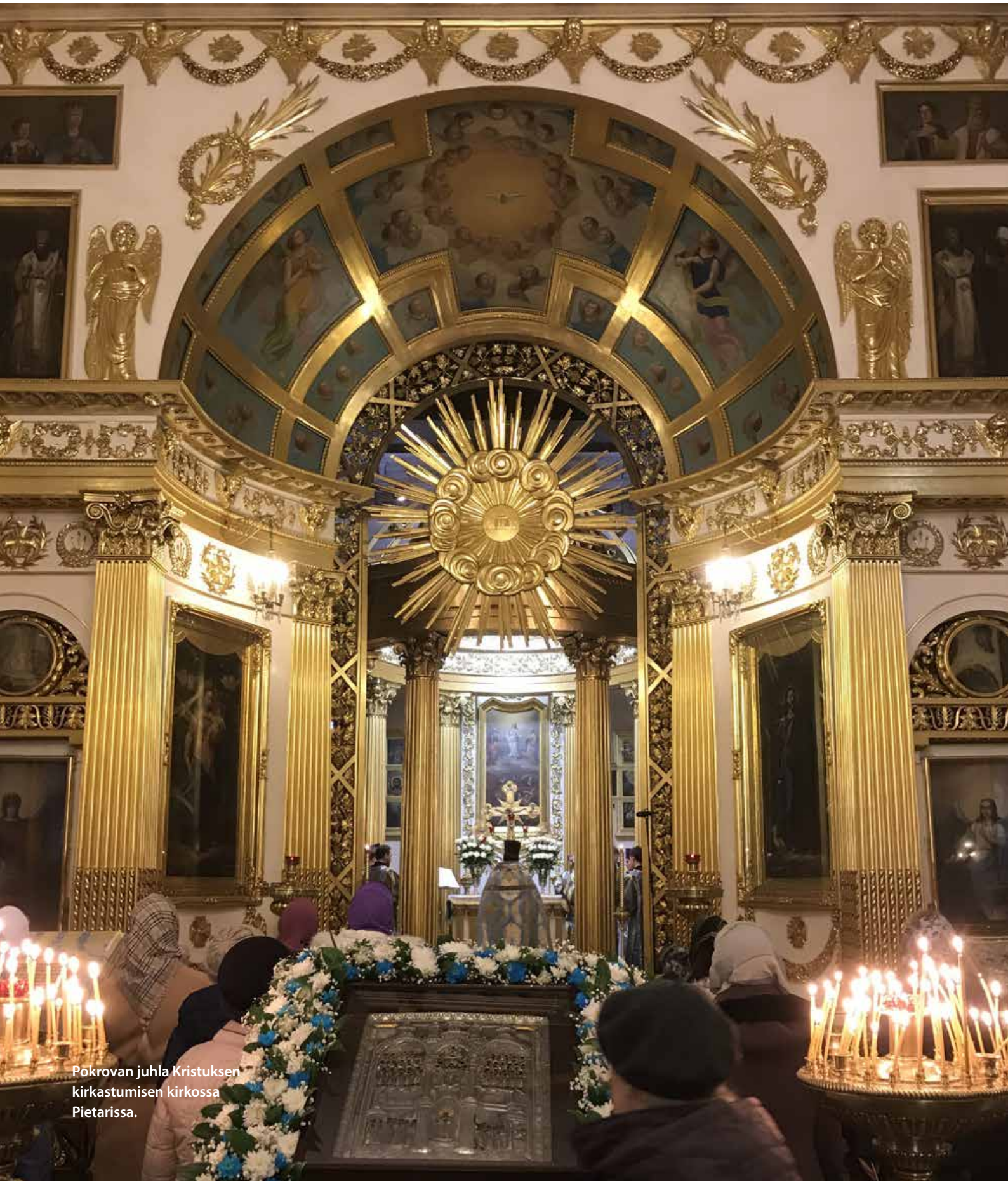
Pokrovan juhla Kristuksen kirkastumisen kirkossa Pietarissa.