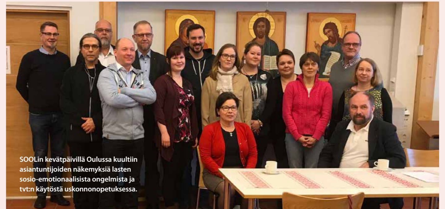
SOOLin kevätpäivillä Oulussa kuultiin asiantuntijoiden näkemyksiä lasten sosio-emotionaalista ongelmista ja tv:n käytöstä uskonnonopetuksessa.

SOOLissa olen toiminut jo 1990-luvulta alkaen, ensin hallituksen jäsenenä, sihteerinä ja myös puheenjohtajana, mutta myös rivijäsenenä. SOOLi on järjestönä jo yli 60-vuotias, mutta toivon voivani omalla panoksella auttaa aikanaan Keiteleen Hiekassa perustetun järjestön työtä kaikkien ortodoksisten opettajien hyväksi.